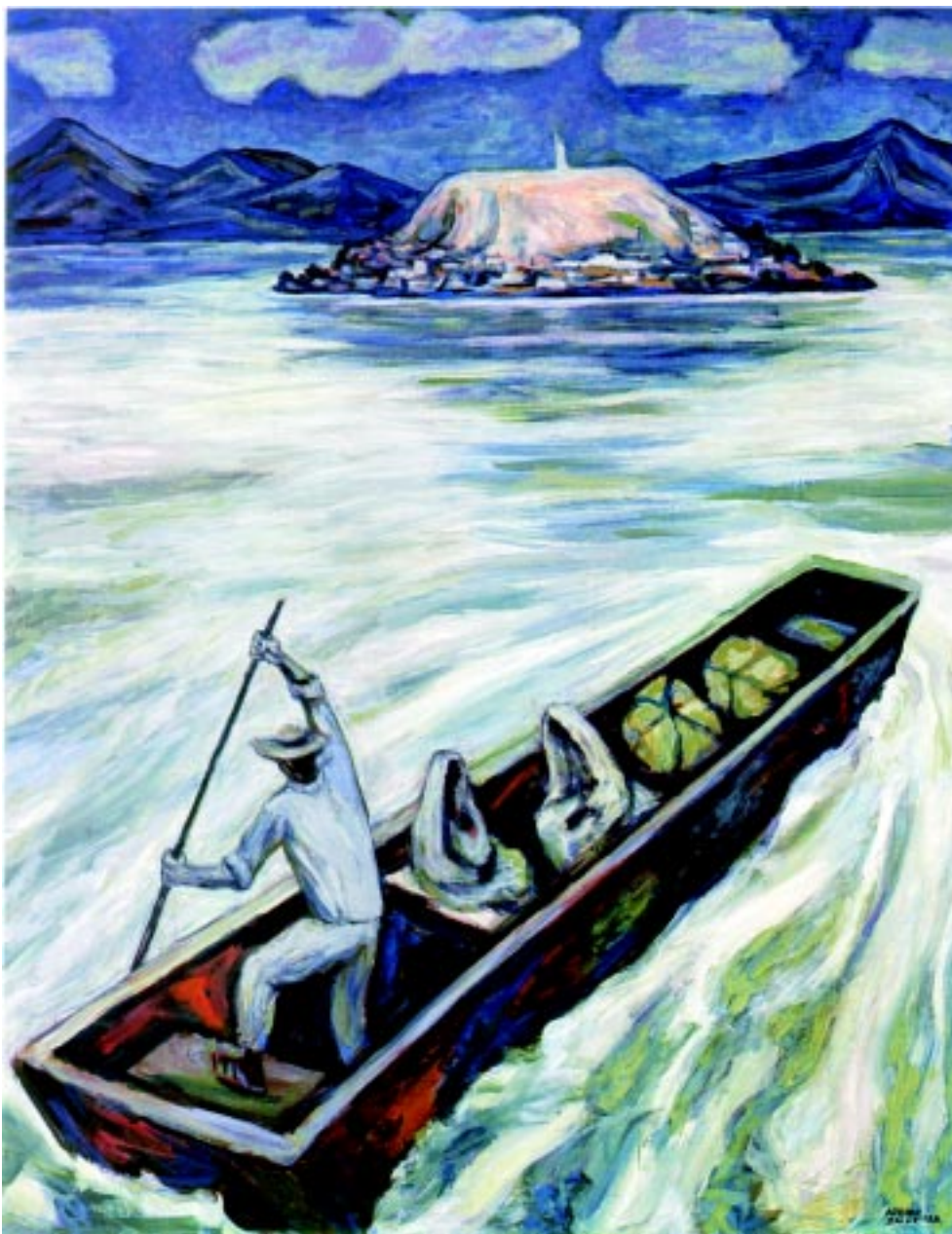
Janitzio , 1988. Óleo sobre mazonite. 122x95cm.