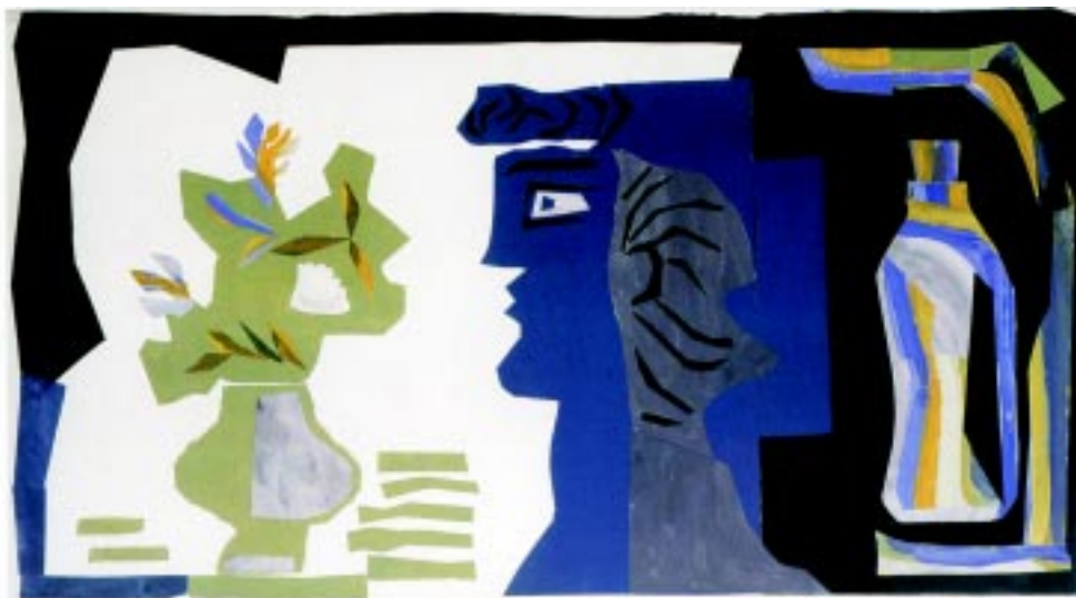
Rostro azul , 1981. Collage de papel. 38x69.5cm.