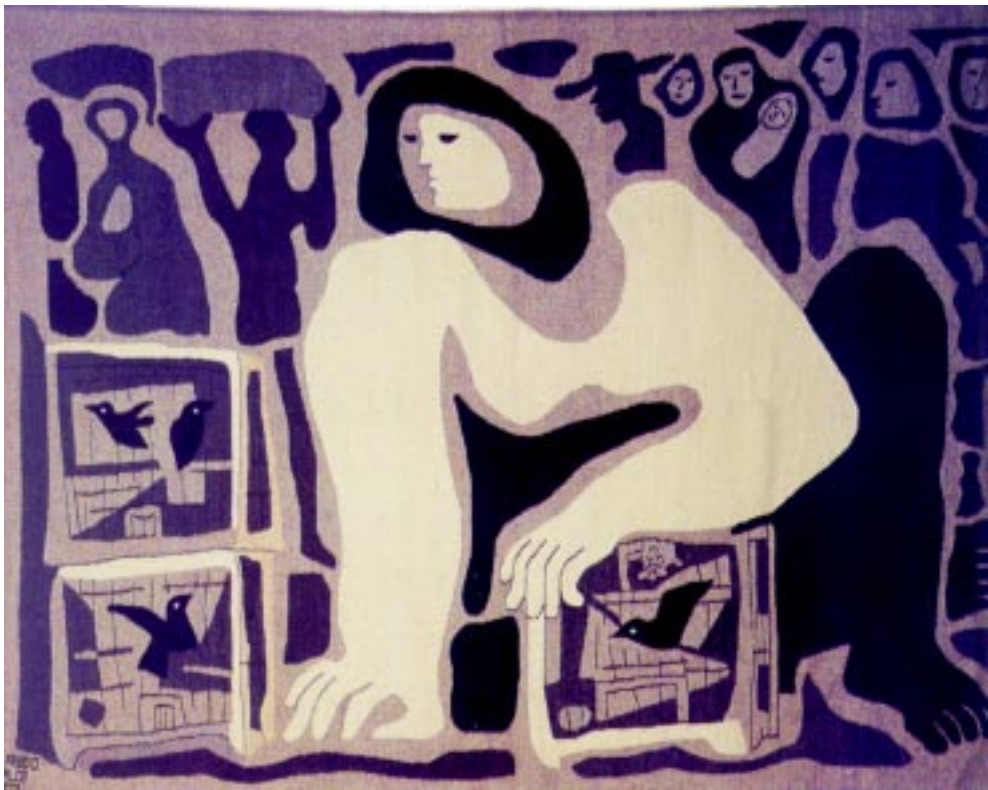
Vendedora de pájaros , 1972. Tapiz técnica de sarape. 173x235cm.

El Maestro Alfredo Zalce ha legado al mundo su obra pictórica en su estampas y pinturas, en las estelas y esculturas; todo como una razón histórica.▲