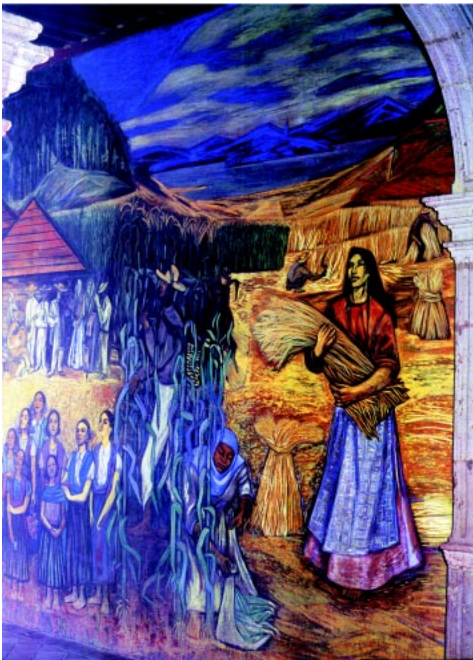
Clima de Michoacán . Mural en el Palacio de Gobierno, Morelia, Mich. 1956.