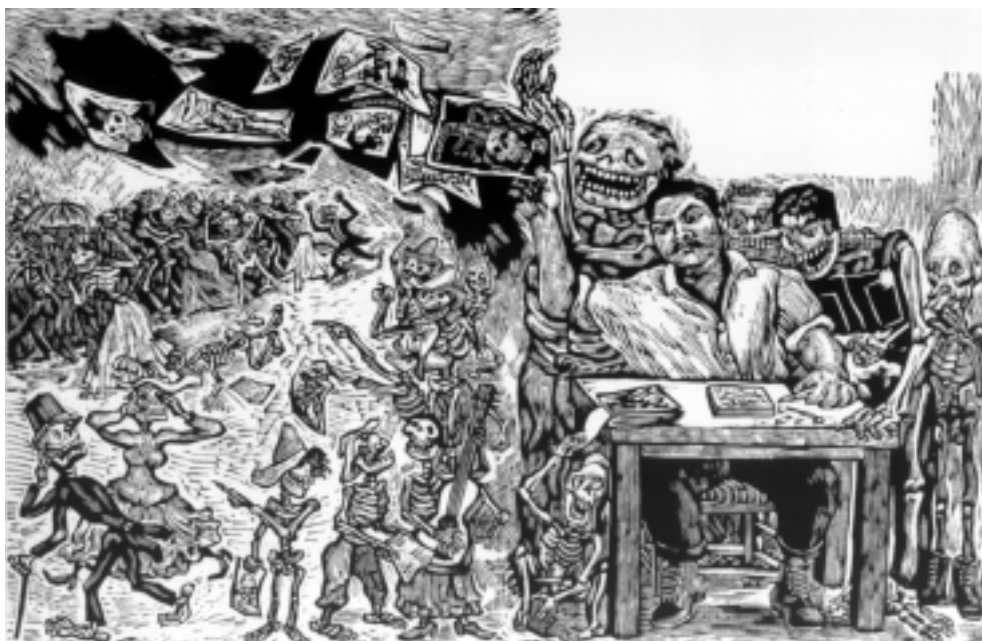
Posadas y sus calaveras , 1968. Grabado en linóleo sobre papel. 29.5x45.5 cm.