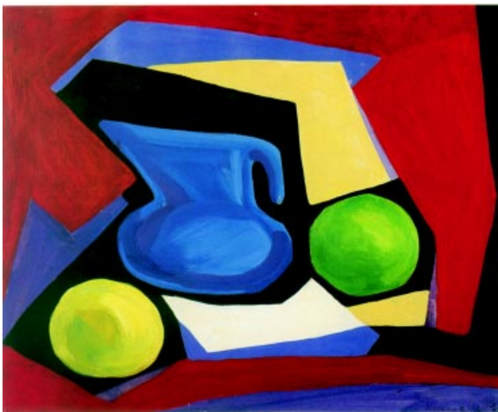
Bodegón con jarra azul , 1967 Goauche sobre papel 41.5x50cm.