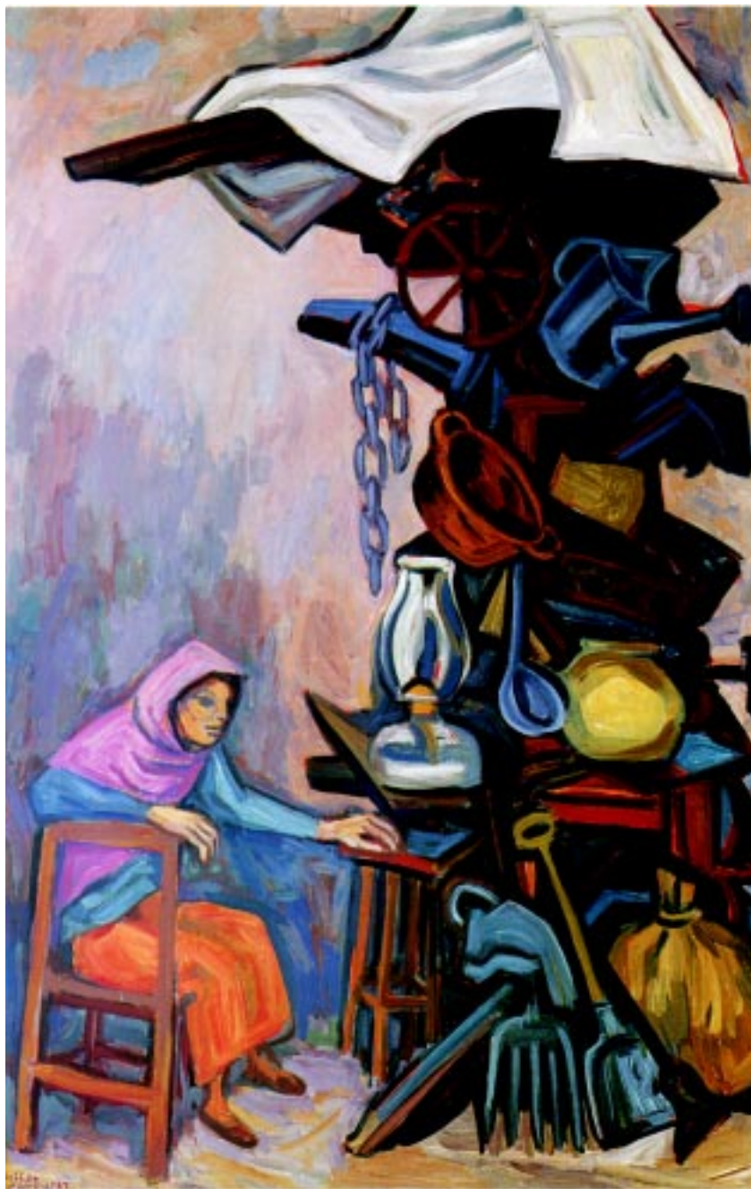
Torre de Babel , 1987. Acrílico sobre tela 121x79cm.