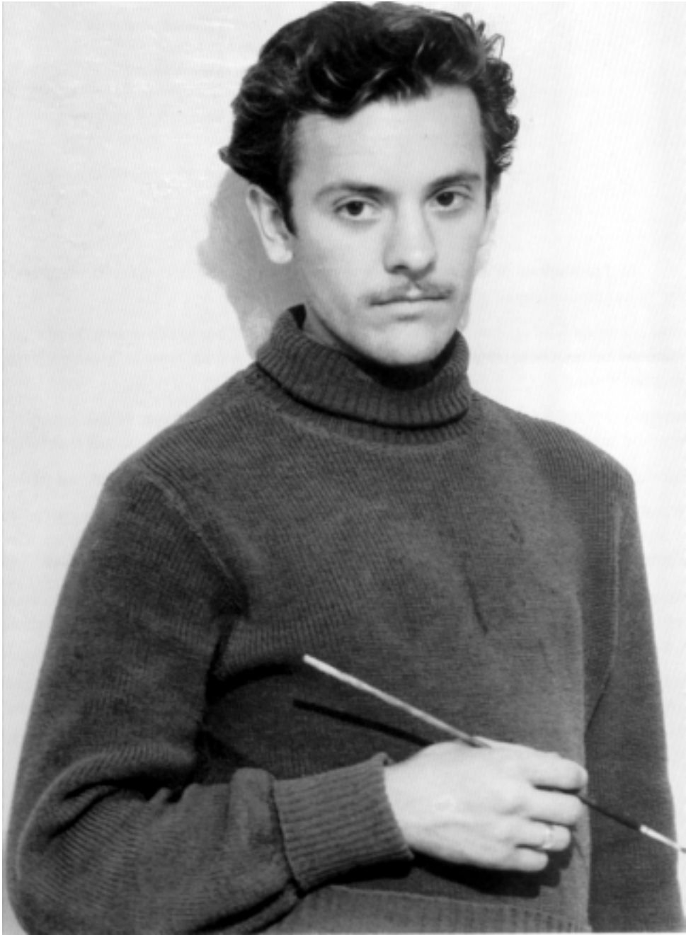
Alfredo Zalce, 1930.