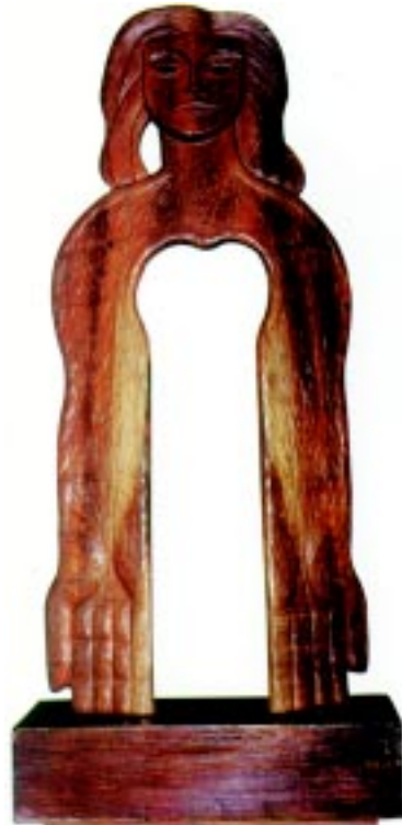
Mujer , 1995. Madera 168x78x39cm.