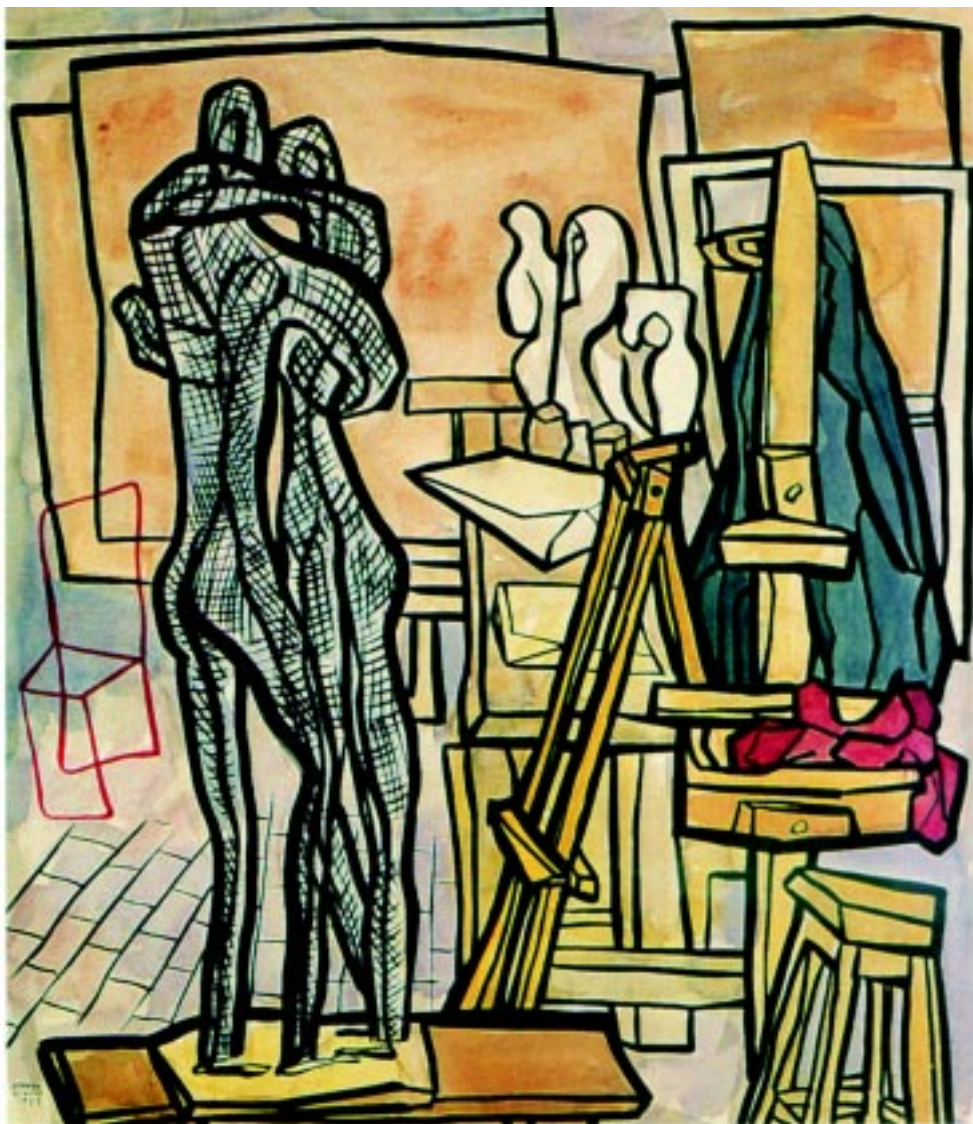
Estudio , 1972 Acuarela sobre papel 57x51cm.