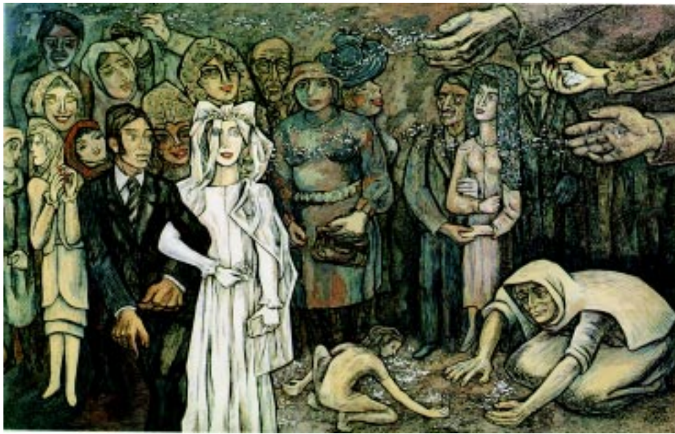
Matrimonio , 1983. Acuarela y tinta sobre papel. 40x62cm.

El proseguir cultivando la posibilidad de apreciar los valores cualitativos en este fin de siglo que se plantea como fin de milenio en las sociedades occidentales, es algo que no parece corresponder con los tiempos. Sin embargo, para mí, de no hacerlo, la vida interior carecería de sentido y por ende mi propia escritura dejaría de tener un objeto. Como dice cierta expresión de origen agrario: hay que saber reencontrar el río, independientemente de su caudal o de la turbina. Y creo que este dicho es aplicable a la trayectoria de Alfredo Zalce.▲