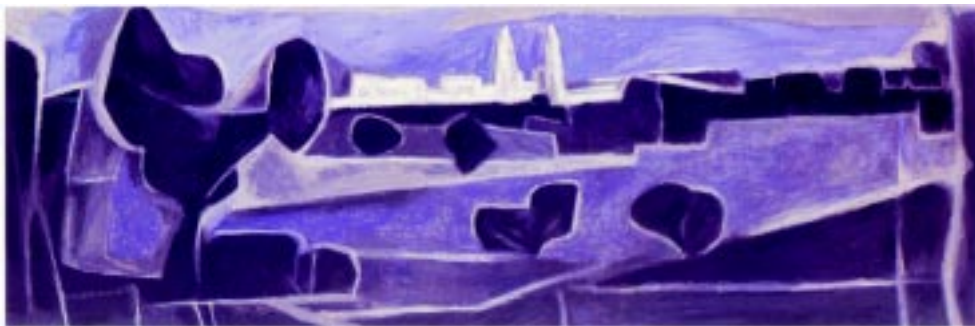
Morelia , 1969. Acrílico sobre mazonite 41x122cm.