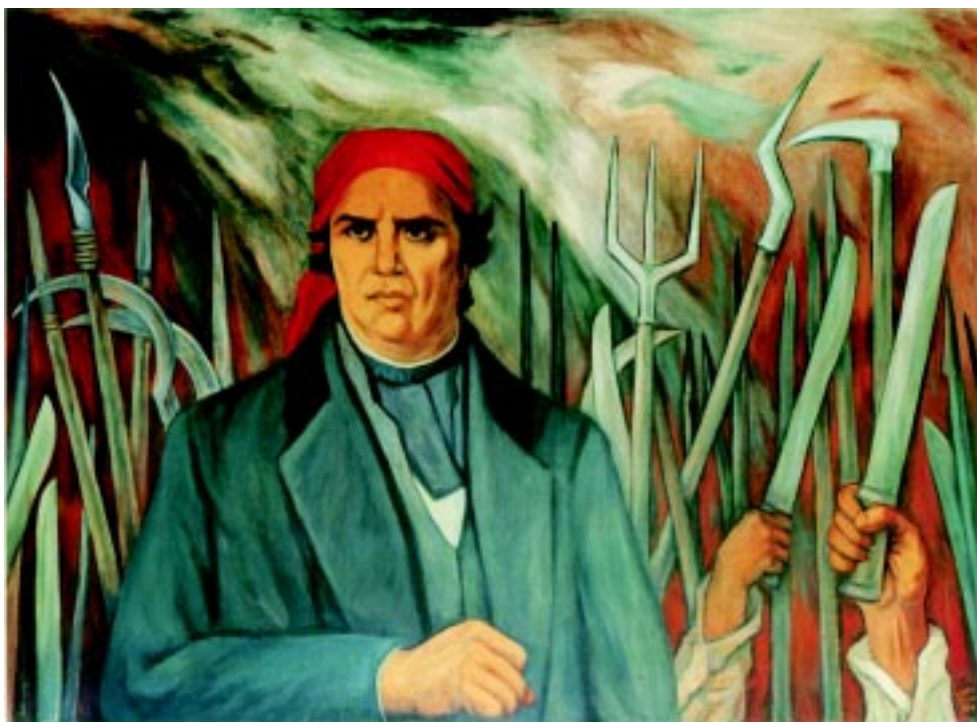
Morelos , 1994. Acrílico sobre tela 155x200cm.