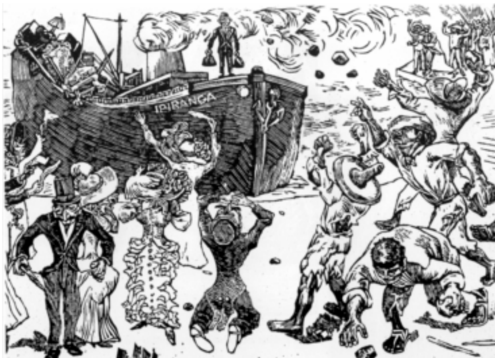
Salida de Porfirio Díaz, 1948. Grabado en linóleo sobre papel 20.5x30cm.