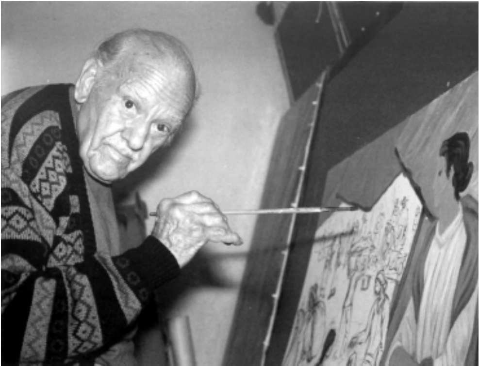
Alfredo Zalce hacia 1990.