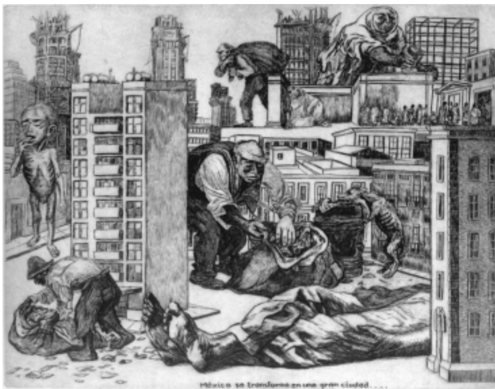
México se transforma en una ciudad , 1947. Grabado a buril sobre papel. 31.5x40cm.