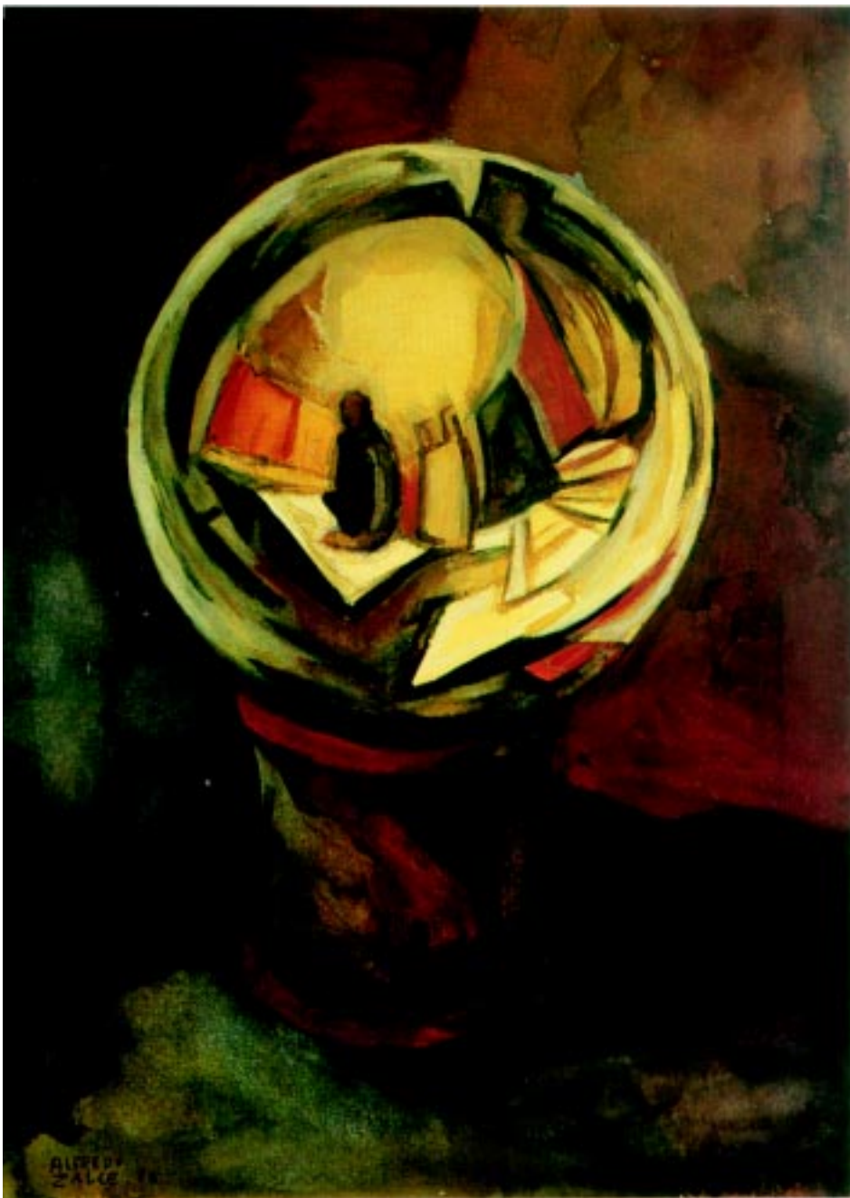
Autorretrato , 1986. Acuarela sobre papel 53x37cm.