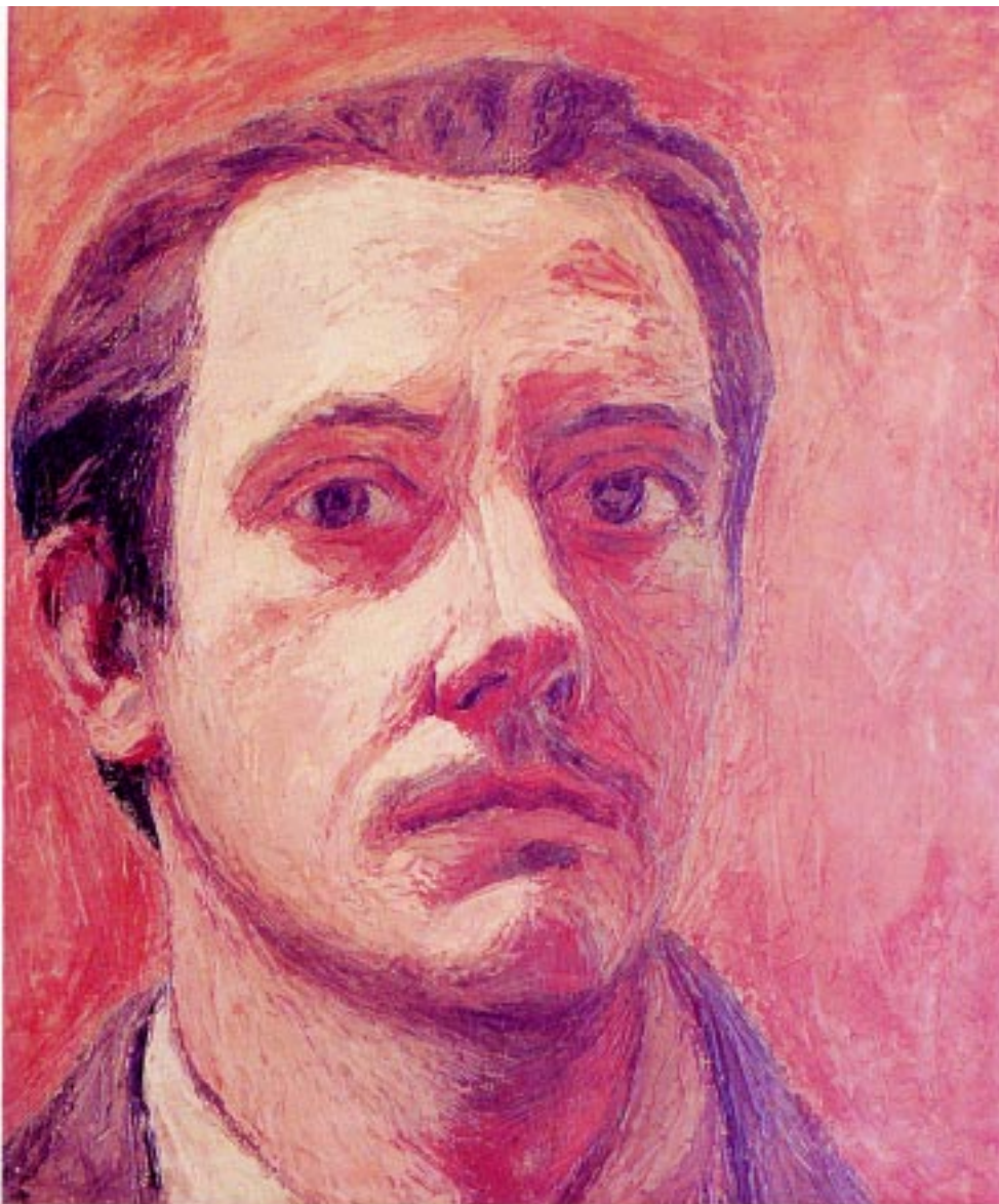
Autorretrato , 1943. Óleo sobre tela. 48x41cm.