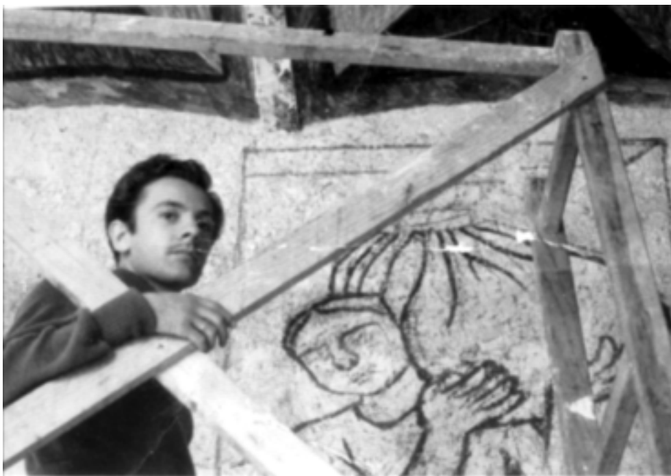
Alfredo Zalce trabajando un mural, 1930.