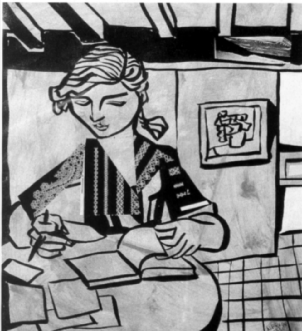
Estudiante , 1960. Tinta y collage sobre papel 33.5x29cm.