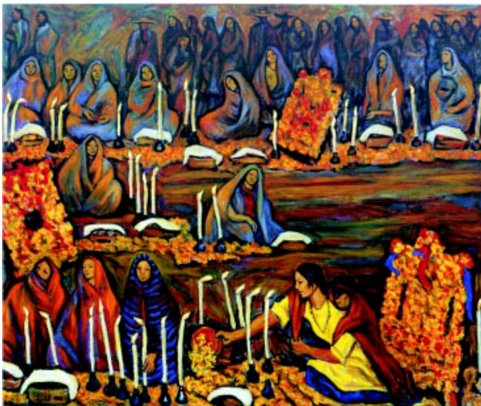
Día de muertos , 1988. Óleo sobre tela. 104x122.5cm.