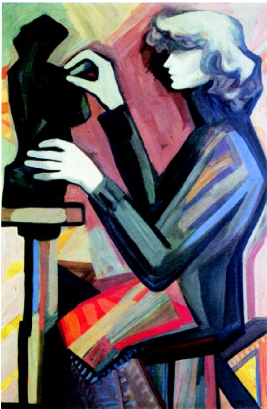
La Escultora , 1980. Acrílico sobre mazonite. 91x60cm.