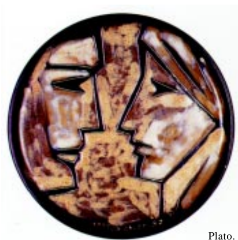
Plato. cerámica. Sin fecha