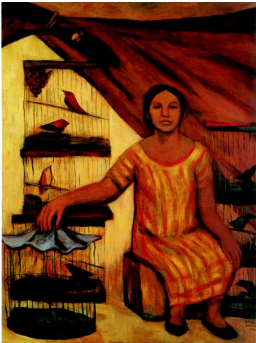
Pajarera , 1990. Acrílico sobre mazonite 115x80cm.