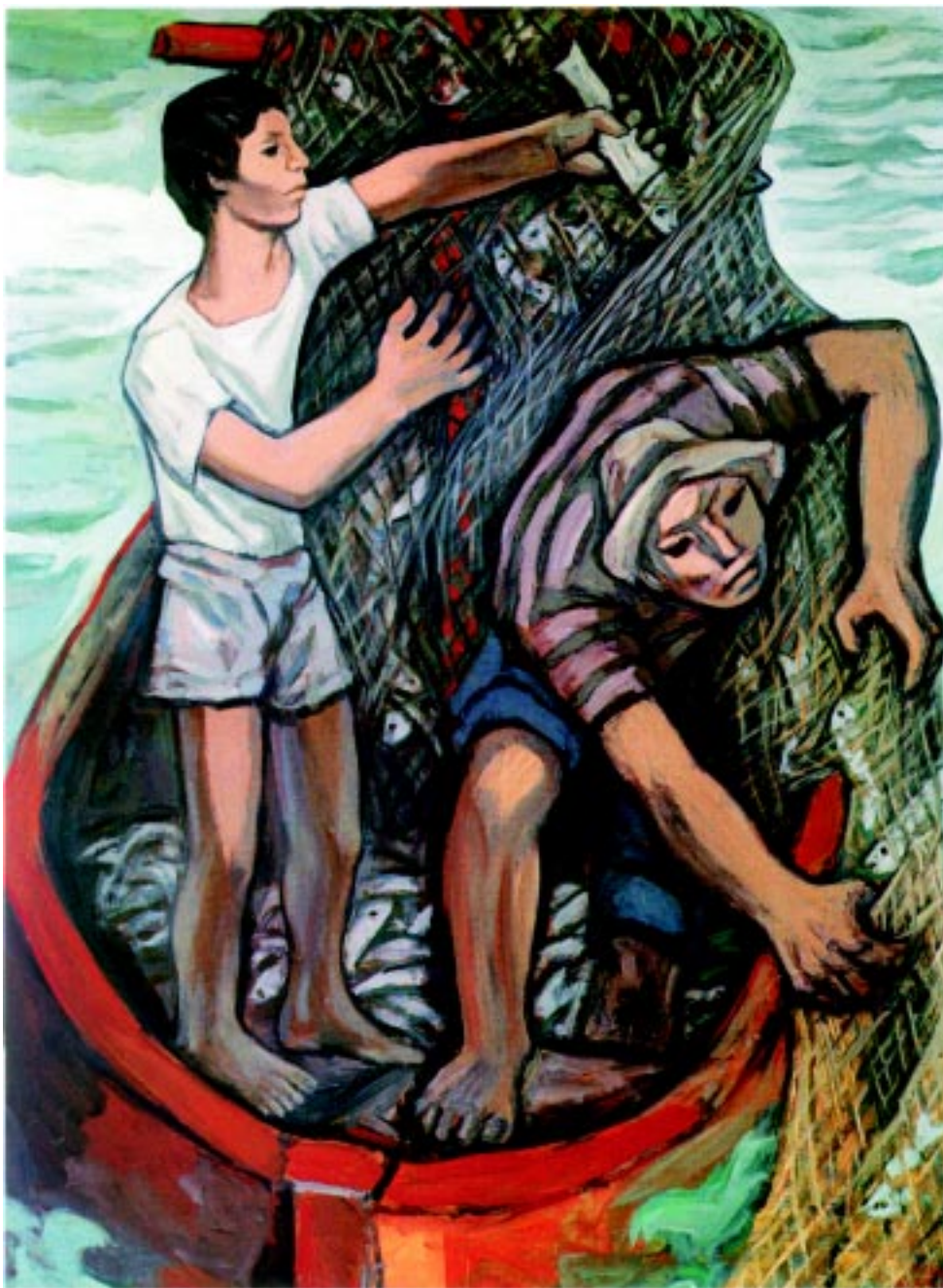
Pescadores , 1983. Acrílico sobre mazonite. 122x92cm.