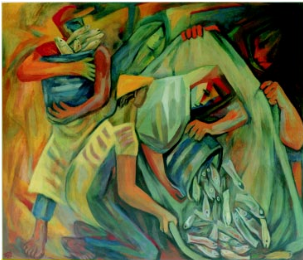
Vendedor de pescado , 1990. Óleo sobre tela. 103x120cm.