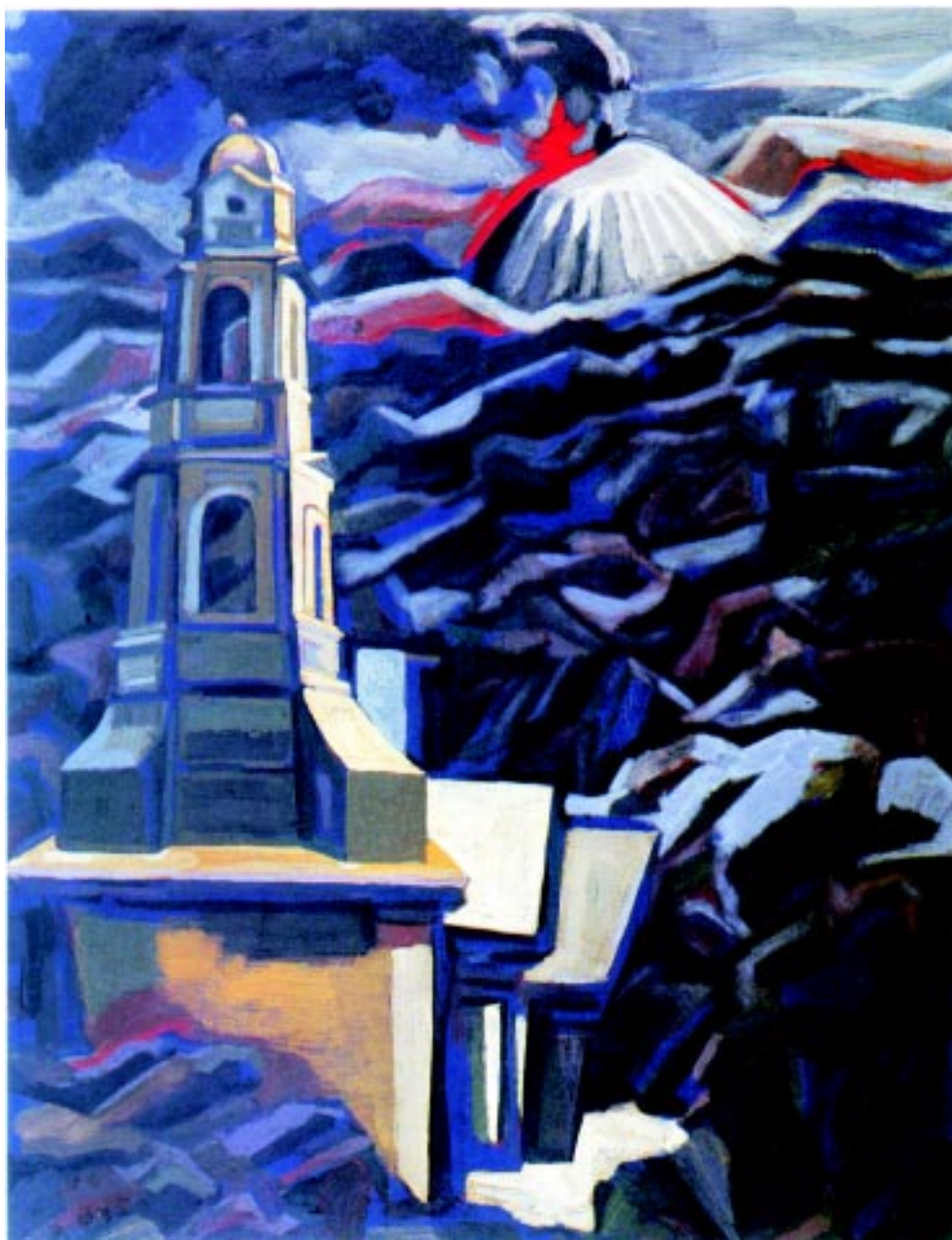
Parícutín , 1949. Duco sobre mazonite 84x65cm.