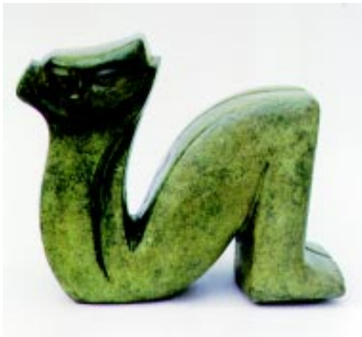
Chac Mool , 1996. Bronce. 27x33x12cm.