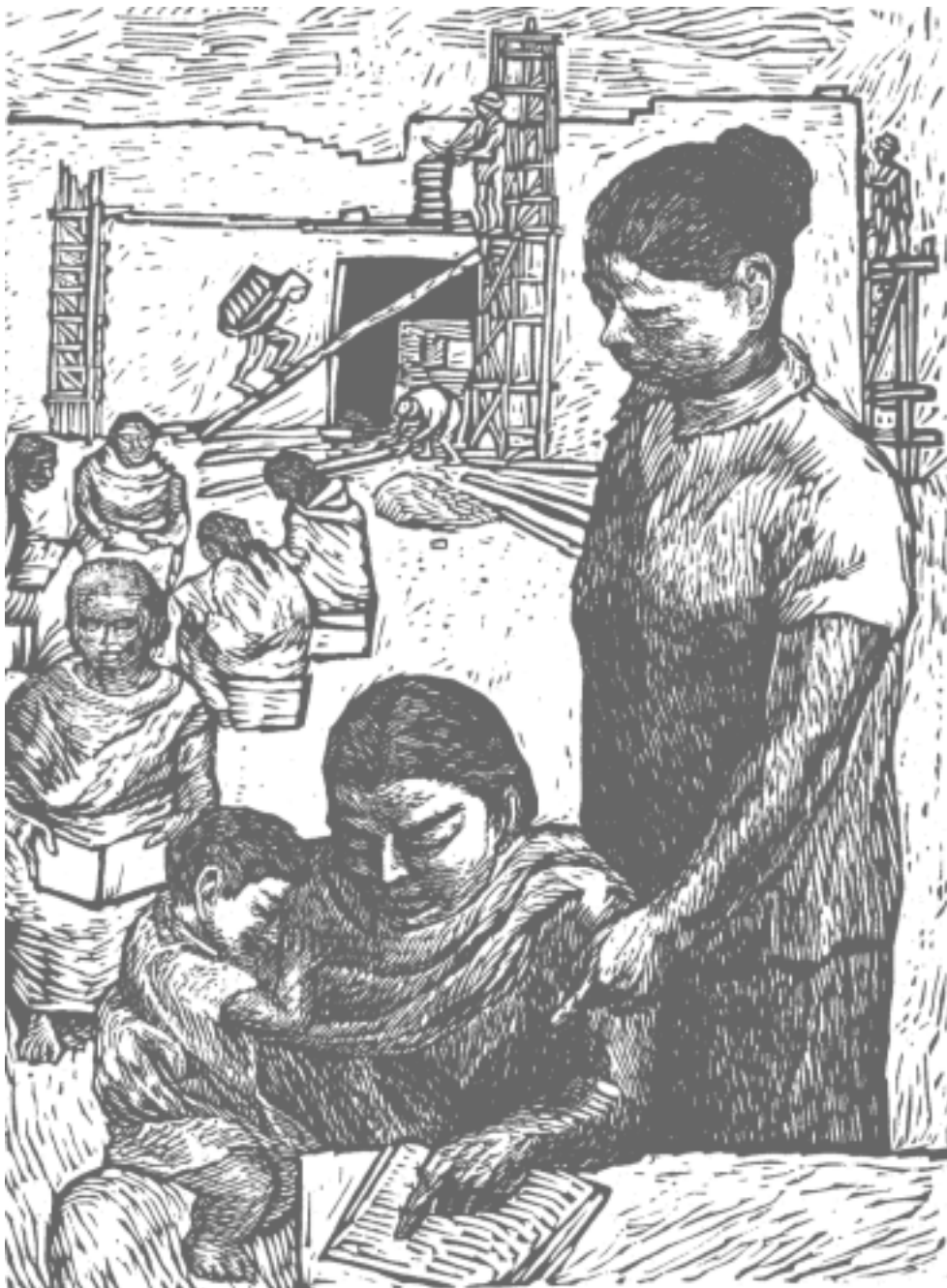
Maestra rural , 1938. Grabado en linóleo sobre papel. 30x20.5cm.