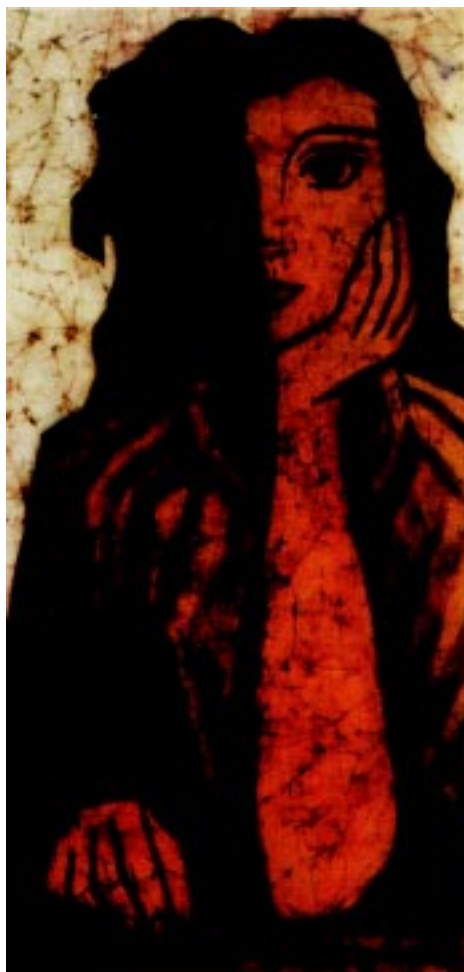
Mujer pensando , 1991. Batik 72x35cm.