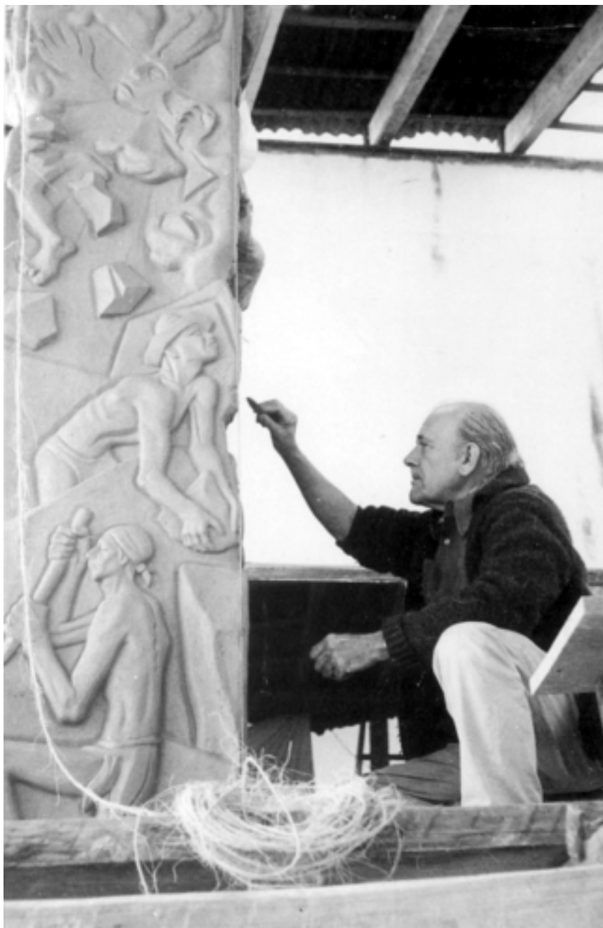
Alfredo Zalce trabajando en las estelas, 1960.