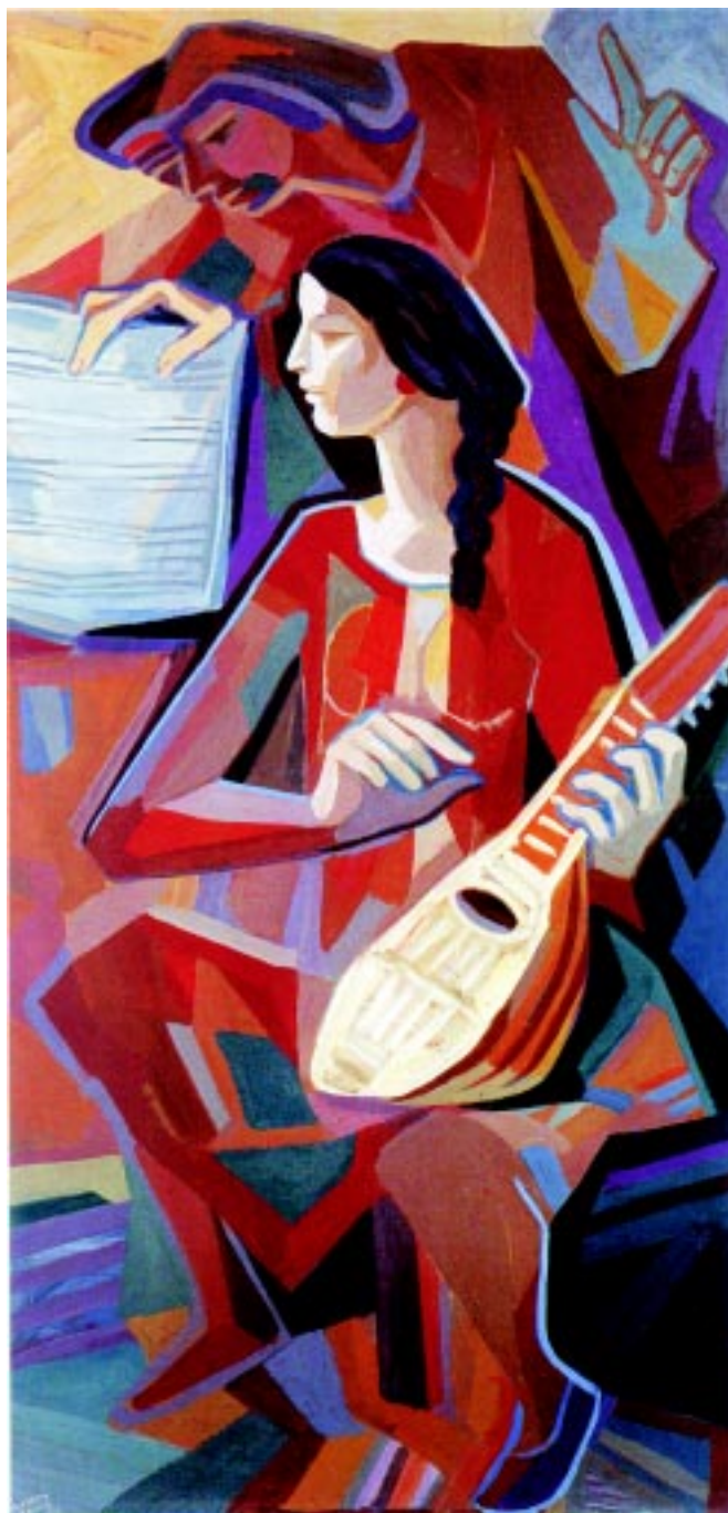
Lección de música , 1980. Acrílico sobre mazonite. 121x60cm.